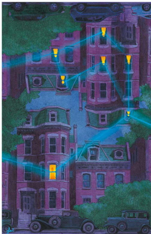
Les Iluminoses, de Lauren Beukes Proposta de coberta alternativa de Ricard Efo

La vida de Kirby Mazrachi s'ha trastocat després del brutal intent d'assassinar-la. Mentre lluita per trobar el seu atacant, el seu únic aliat és en Dan, un reporter d'homicidis que va tractar el cas i intenta protegir-la de la seva obsessió. A mesura que la Kirby avança en la investigació, descobreix altres noies, les que no van