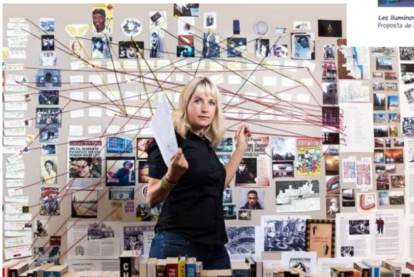
La autora Lauren Beukes y su organigrama para Las luminosas